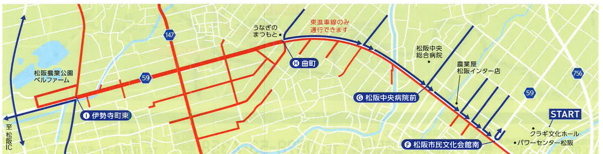
スタート会場付近~松阪IC 9:15~12:30