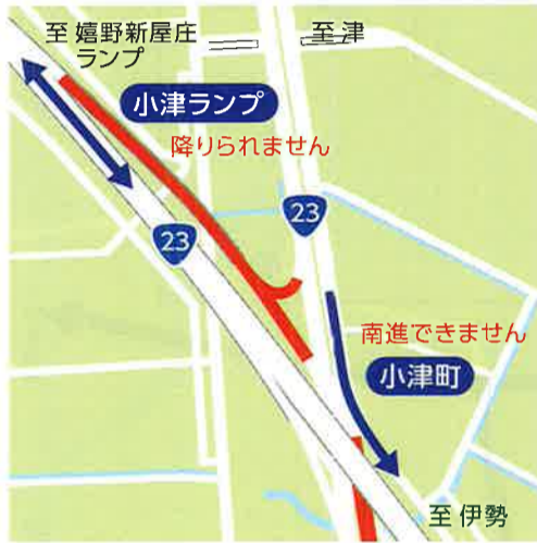
C 小津町/小津ランプ 8:15~11:50