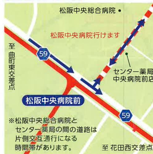
G 松阪中央病院前 9:15~11:50