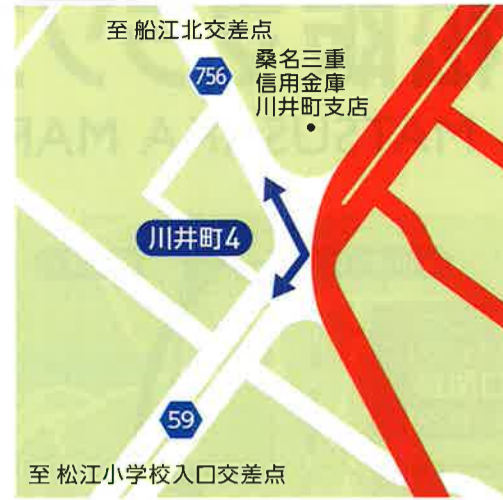
A 川井町4 8:15~11:15