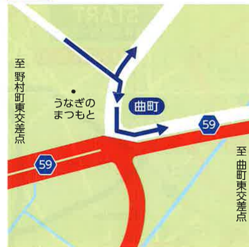
H 曲町 9:15~12:30