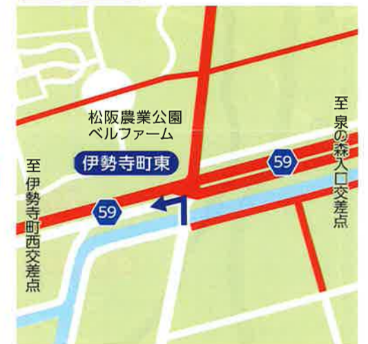
I 伊勢寺町東 9:15~12:30