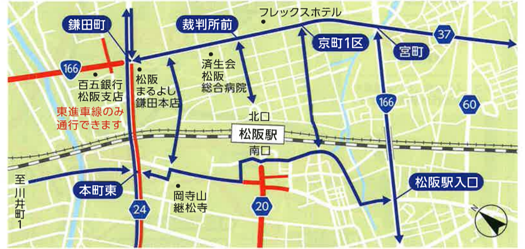
E 松阪駅前 8:40~11:15