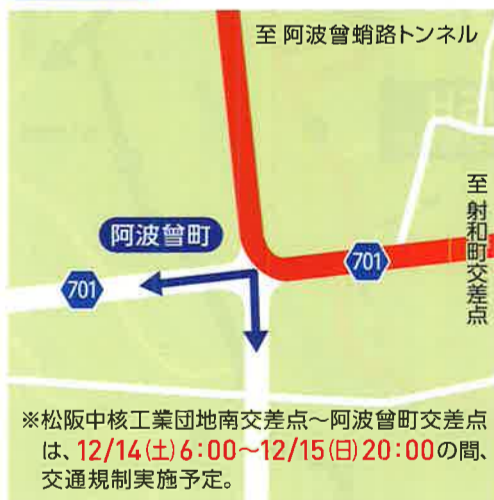
J 阿波曾町 10:00~15:00*