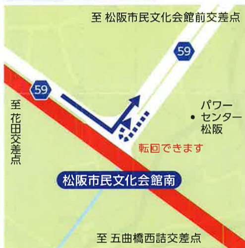
F 松阪市民文化会館南 9:00~11:50