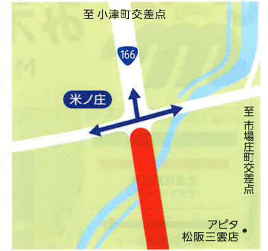
B 米ノ庄 8:15~10:15