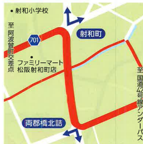
K 射和町/両郡橋北詰 10:00~15:20