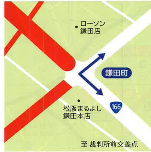
D 鎌田町 8:15~10:45